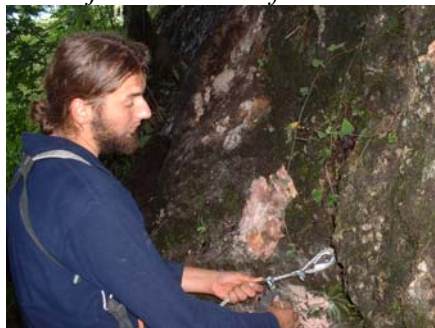
Amenajare traseu via ferrata

Finantator principal: Fundatia pentru parteneriat Miercurea Ciuc, valoarea finantarii: 4.800 euro. Rezultatele proiectului: realizarea documentatiei stiintifice pentru declararea pesterii Unguru Mare arie naturala protejata, realizarea a doua trasee turistice tematice (carst si flora) in zona Suncuius, formarea a 4 ghizi locali de turism, tiparirea unor pliante de prezentare a pesterii, tiparirea unor fluturasi cu reguli de etica in natura, realizarea unor panouri informative si de avertizare.